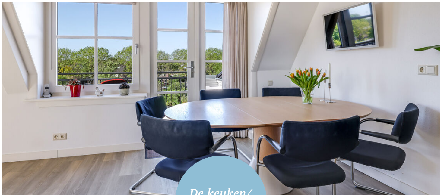
De keuken/ eethoek